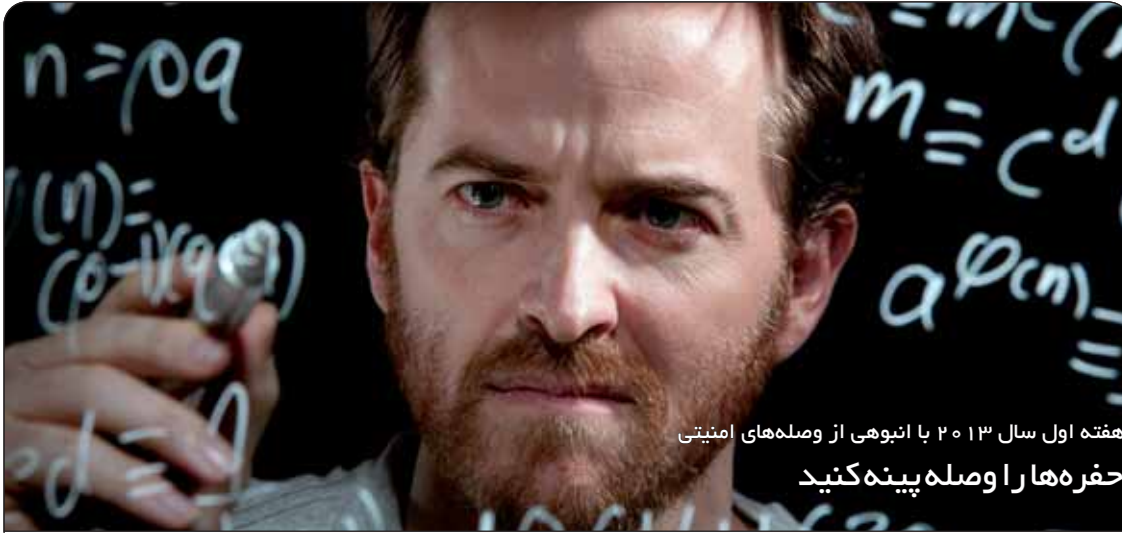
هفته اول سال ۱۳۹۰ با انبوهی از وصله‌های امنیتی حفره‌ها را وصله‌پینه کنید

کشف شده در سرویس درایور نمایش را که در تعطیلات کریسمس افشا شده بود، برطرف می‌کند. اگر شما صاحب یک واحد پردازش گرافیکی GeForce باشید، عرضه بی‌سر و صدای درایورهای اخیر مبتنی بر GeForce برای شما بسیار ارزشمند خواهد بود. نقص امنیتی مربوطه به مهاجمان راه دور با یک حساب کاربری دامنه اجازه می‌دهد به سیستمی که درایورهای قدیمی‌تر را اجرا می‌کند، دسترسی پیدا کنند. این به‌روز رسانی علاوه بر ترمیم نقص امنیتی فوق به بهبود کارایی گرافیکی رایانه‌ها، به‌خصوص در مورد اجرای برخی از بازی‌ها کمک می‌کند. شرکت گوگل نیز در همین زمان اقدام به بستن حفره‌های امنیتی بالقوه‌ای کرده است که توسط یک گواهینامه جعلی برای دامنه google.com ایجاد شده است. این گواهینامه به طور نادرست توسط منبع صدور گواهی TurkTrust صادر شده است. گواهینامه میانی CA حاوی مدارک کاملی از CA است؛ بنابراین هر کسی می‌تواند از آن اطلاعات و مدارک آن استفاده نماید و برای وبسایت‌های دیگر گواهینامه‌های جعلی صادر کند. شرکت گوگل این گواهینامه را در Christmas Eve شناسایی کرد و سپس برای مسدود ساختن این CA میانی مرورگر کروم خود را به‌روز نمود و TurkTrust و سایر مرورگرهای دیگر را از این مسئله مطلع ساخت. TurkTrust پس از انجام تحقیقات، متوجه شد که در اوت ۲۰۱۱ به طور اشتباه دو گواهینامه CA را برای سازمان‌ها منتشر کرده است. پس از این تحقیقات شرکت گوگل گواهینامه CA دوم را نیز مسدود ساخت.