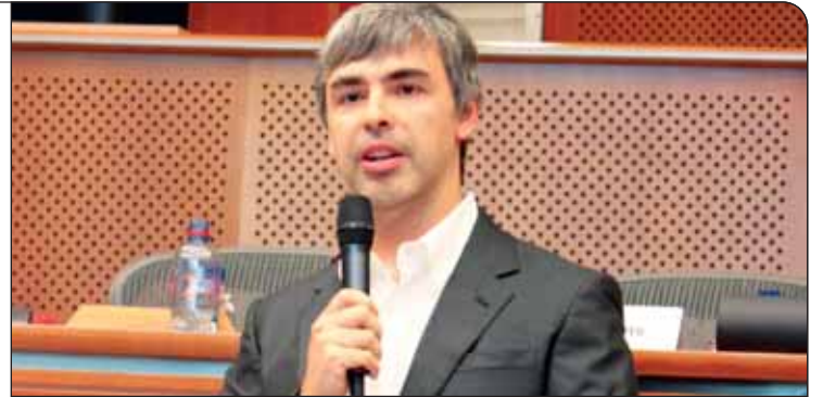
از آوریل سال ۲۰۱۱ «لری پیج» به عنوان مدیرعامل شرکت گوگل انتخاب شد و از آن زمان تا به حال تنها دو بار با مجله‌های چاپی مصاحبه داشته است

این یک سؤال تقریباً بی‌پاسخ است و به هیچ عنوان نمی‌توان پیش‌بینی خاصی در این رابطه انجام داد. فقط من می‌دانم که انگیزه من بسیار زیاد است و با همه وجود در تلاش هستم تا بتوانم گوگل را به یک شرکت جالب و بسیار موثر تبدیل کنم و بتوانم جهان را بیشتر از این تحت تاثیر قدرت گوگل قرار دهم.